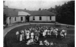
Widok z południa na Dalewice, lat 1900-1910