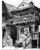
Widok z południa na Nowy Wiśnicz, lat 1900-1910

Nowy Wiśnicz, dawniej... W 1700 roku... W 1800 roku... W 1900 roku... W 1914 roku... W 1918 roku... W 1920 roku... W 1925 roku... W 1930 roku... W 1935 roku... W 1940 roku... W 1945 roku... W 1950 roku... W 1955 roku... W 1960 roku... W 1965 roku... W 1970 roku... W 1975 roku... W 1980 roku... W 1985 roku... W 1990 roku... W 1995 roku... W 2000 roku... W 2005 roku... W 2010 roku... W 2015 roku... W 2020 roku...