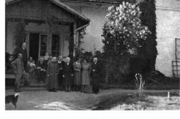
Widok z północnego zachodu na Dalewice, lat 1900-1910