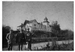
Widok z północnego zachodu na Przyszowa, lat 1900-1910