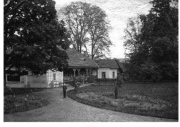
Widok z południa na Jodłownik, lat 1900-1910

W zachodniej części Jodłownika... W 1700 roku... W 1800 roku... W 1900 roku... W 1914 roku... W 1918 roku... W 1920 roku... W 1925 roku... W 1930 roku... W 1935 roku... W 1940 roku... W 1945 roku... W 1950 roku... W 1955 roku... W 1960 roku... W 1965 roku... W 1970 roku... W 1975 roku... W 1980 roku... W 1985 roku... W 1990 roku... W 1995 roku... W 2000 roku... W 2005 roku... W 2010 roku... W 2015 roku... W 2020 roku...