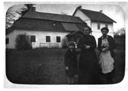
Widok z południa na Dalewice, lat 1900-1910