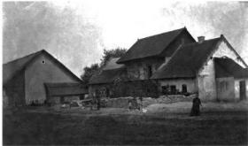
Widok z południa na Dalewice, lat 1900-1910