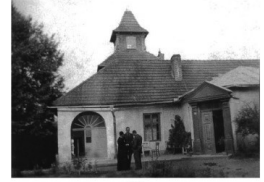
Widok z północnego zachodu na Dalewice, lat 1900-1910