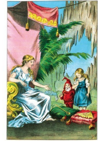
O Królowej Tetry