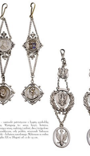
Srebro - srebrny medal. Wykonany w Warszawie w latach 1850-1860. Waga 1000 g. Wysokość 10 cm, szerokość 12 cm, głębokość 10 cm. Cena 1000 zł.