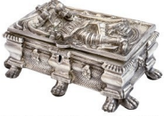
Srebro - srebrny skrzynka. Wnętrze srebrne, pokryte złotem i ozdobione koralami. Wykonane w Warszawie w latach 1850-1860. Waga 1000 g. Wysokość 10 cm, szerokość 12 cm, głębokość 10 cm. Cena 1000 zł.