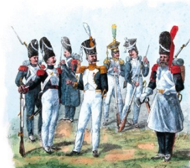
K. Wawer malował i ryc. J. Kłopotki rytował. B. W. Dzierżal jędrzejowski w Krakowie.

Przesyłając do wiadomości Wojska, któremu mam zaszczyt dowodzić, przepis Munduru przez