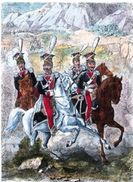
K. Wawer malował i ryc. J. Kłopotki rytował. B. W. Dzierżal jędrzejowski w Krakowie.

Mundur galowy — Składa się z kurtki sukiennej, koloru granatowego, krojem Polskim, podszycy kołozą karmazynową; kolnierze stojący z sukna karmazynowego; wyłogi i łapki na rękawach okrągłe, granatowe. Kurtka zapinać się będzie wzdłuż od góry do dołu, na hafiki; kieszenie wzdłuż, z trzema kantami; wypustka karmazynowa, na około wyłogów, łapek na szwach rękawów i na plecach. Guziki srebrne wypukłe na których znaydować się ma robotą wypukłą (en relief) Orzeł Polski; na wyłogach z każdej strony po siedm guzików, przy każdej kieszeni po trzy, z tyłu na fałdach po dwa, do każdej szlify po jednemu. Kamizelka biała krótka, której nie widać z pod kurtki. Spodnie długie z sukna karmazynowego, z lamпасami