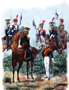
K. Wawer malował i ryc. J. Kłopotki rytował. B. W. Dzierżal jędrzejowski w Krakowie.

Serya II. Wojsko jeździecze po r. 1800. Tab. 185.